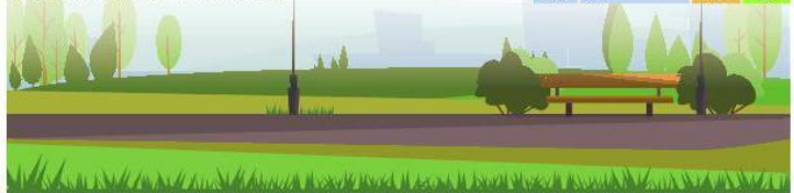
La classifica è calcolata sui coefficienti di spazi verdi e potature